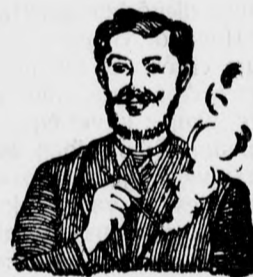
Egger-mellpasztilla csakhamar meggyógyított!