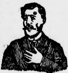
Megfójt ez az átkosult köhögés.

KÖHÖGÉS, REKEDTSÉG és elnyálkásodás ellen gyors és biztos hatásuak