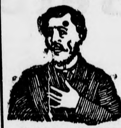
Magfojt ez az átkozott köhögés.

KÖHÖGÉS, REKEDTSÉG és elnyálkásodás ellen gyors és biztos hatásuak