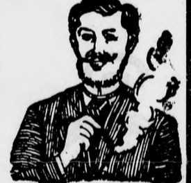
Egger-mellpasztilla csakhamar meggyógyított!