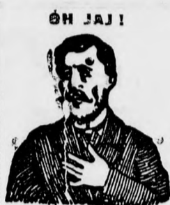
Mag. orv. az. kiképzett köhögés.

Fizetés gyanánt levélbélyegeket is elfogad.