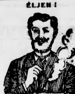
Egger-mellpasztilla csakhamar meggyógyított!