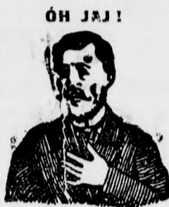
Megójt ez az átkozott köhögés.

Fizetés gyanánt levélblyegetek is elfogad.