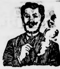
Egger-mellpasztilla csakhamar meggyógyított!