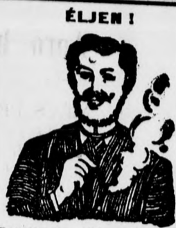
Egger-mellpasztilla csakhamar meggyógyított!