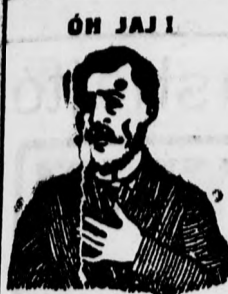
Megfojt ez az átkozott köhögés.