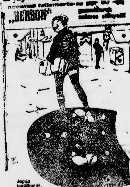
Fordító lapos, kistűs, lárnák, az idegek rázkódásán kívül a szervezetek Budapest, Vn.