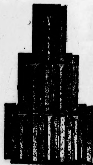
Nagykikindai gyártmány, Bohn-féle szab. biztonsági átfedőcserep 272 szám.