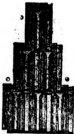
BOHN kikindai cserepe.