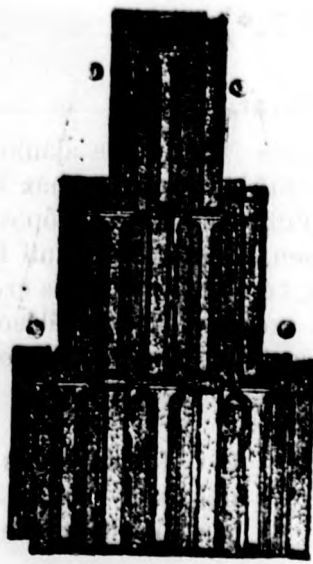
BOHN kikindai cserepe.