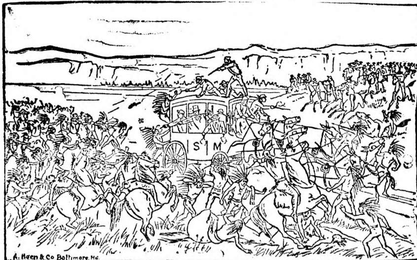
INDIANS ATTACKING THE OVERLAND MAIL COACH.

Az express pony. Mexikói lovasok és lasszodók csoportjai. 6 orslövész. Igazi arab lovasok és athléták. Orosz kozákok a Kaukázusból. Fiatal indiánok kedvelt mulatságokban. Hogy kell a „Bucking Bronchos“-okra (vadló) felülni. A vad lovak befogása a lasszó által. Egy kivándorló csapatjának megtámadása. Lovassági hadi gyakorlatok és katonai evolúciók. A híres deadwoodi gyors posta. A cowgirls négyese lóháton. Az indiánok haditáncja, 100 indiánus vörösbőrű.