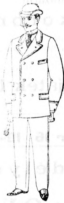
Öltöny 13 frt 50 kr. és feljebb.