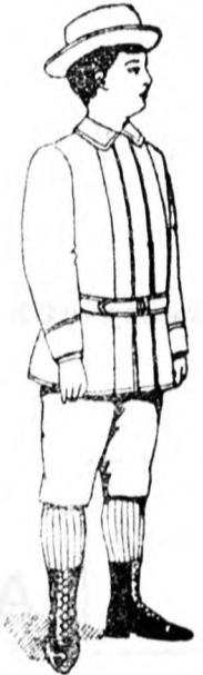
Gyermek Costüm 5 frt és feljebb.