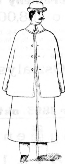
Utazó köpeny 17 frt és feljebb.