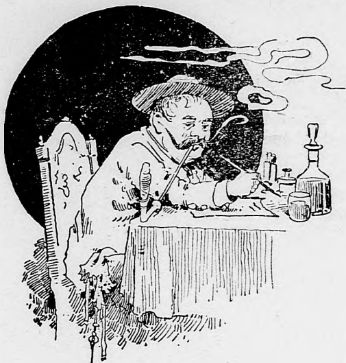
Öndőd, fagyos szentek első napján.

— debreczeni hejjes pógár levele a szerkesztőhöz. —