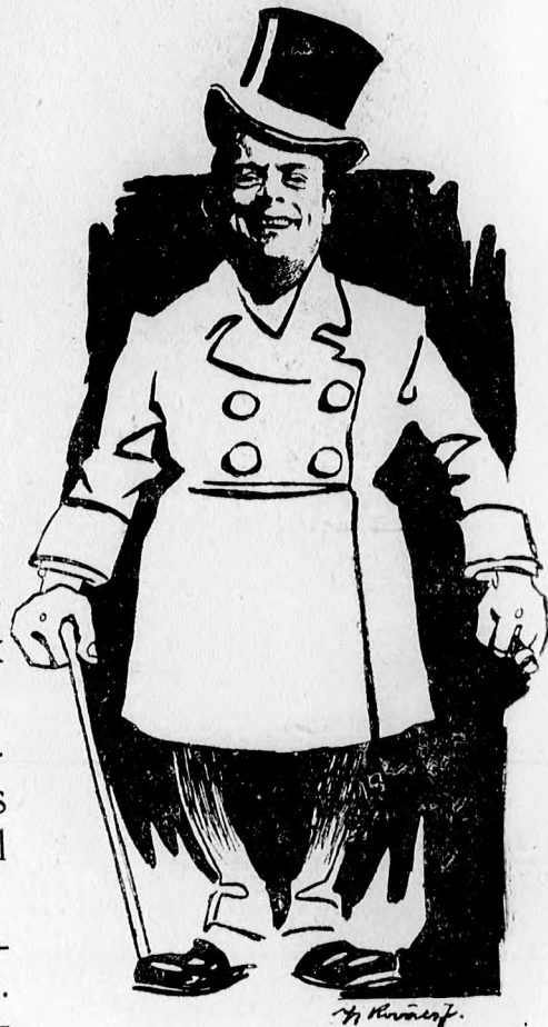
Hála Istennek! Vége van a vig-estének.

Zilahy (a Muzsikus leány premierje után): Kí meri tagadni ezután, hogy nálam még a szamarak is érvényesülnek.