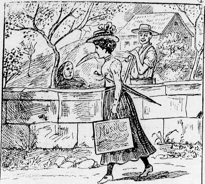
Megy a kisleány iskolába, Gavallér van a nyomába'.