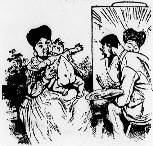
Mikor a dada modelt ül.