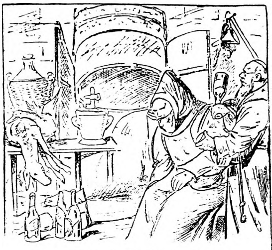
Hol a harmadik barát?