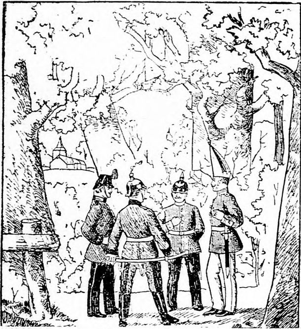
Hol a két leányzó? (Tessék megkeresni.)

„Hát a burgonya is az égből jön? Hiszen az a földben van!”