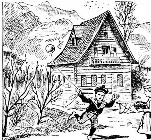
A kis gyermek neki lódul, Mert nem tudja, hol a nyúl. Hol van? Tessék megkeresni!

MIHALOVITS J. gyógyszertára a „Kigyóhoz“ DEBRECZEN, Fötér, a vár osházzal szemben.