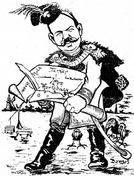
A Hortobágy Királya: Megállj, vén kopasz zsigori, ha nem akarsz jószántadtól annyit adni, amennyi téled telik, hát kihasítom a bőrödöt. (Kihasít tizezer holdat a Hortobágy testéből.)