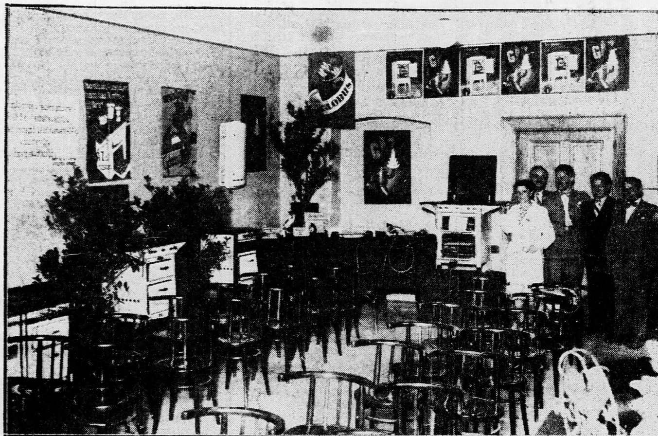
A gázfőzőverseny színhelye

A Világítási Vállalat nagyszerű propaganda-bemutatója — Uj tervek a fogyasztók hasznára