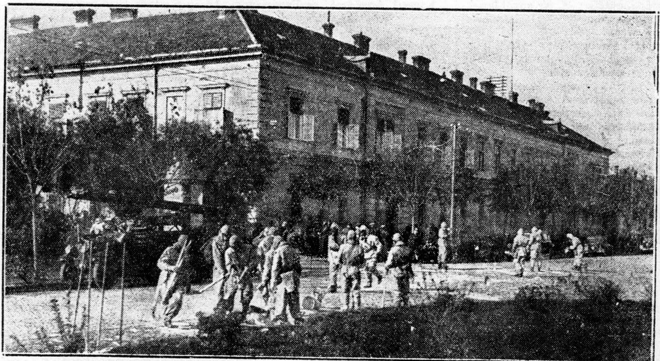
Munkában a gáztalanító osztagok a Péterfia uccán

és felmentette a francia előőrsöket. Az elzászi arcvonalon a Lauter és a Rajna mentén folyó helyi jellegű ütközetek, valamint felderítő járőr-csatározások nem befolyásolták az általános harctéri helyzetet. (MTI)