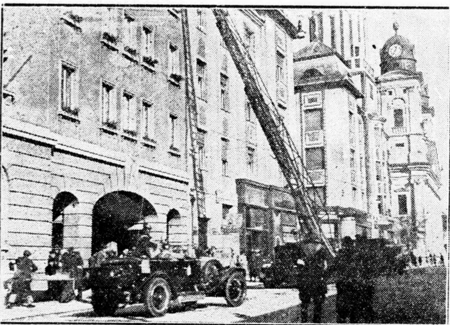
„Ég a postapalota”

A postapalotát több helyen is érte találat. Ide is gyújtóbombákat és gázbombákat dobtak. A tüzőltőség a hatalmas Magirus tolólétrával, egy másik motoroskocsival és lovasszerelvényvel vonult a helyszínre. A Magirus tolólétra pillanatok alatt emelkedett a postapalota tetejére és a tüzőltők másodpercek alatt érték a tetőre a vízvezetékbe kapcsolt gumitömlőkkel. Ezalatt pedig lenn az uccán a gázvédelmi osztályok dolgoztak.