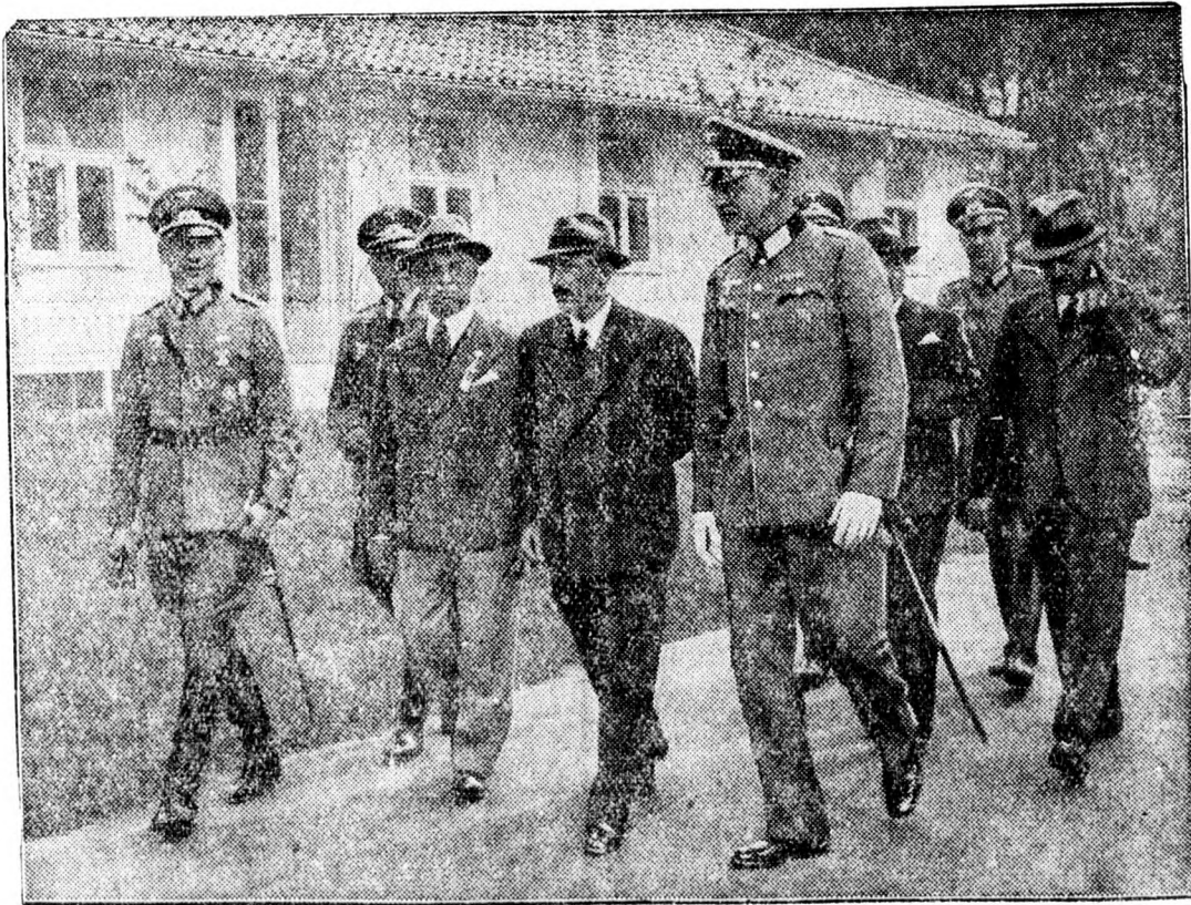
Boris bolgár király meglátogatja az olimpiai falut. (Középen, sötét polgári ruhában).

A most megindított nyomozás elé a legnagyobb érdeklődéssel tekint Amerika és Európa tengerhajózási társasága, amnél is inkább, mert úgy hiszik, hogy ha negyvenöt évig nem, de most sikerül a hallgatás-szigetének titkát megfejteni.