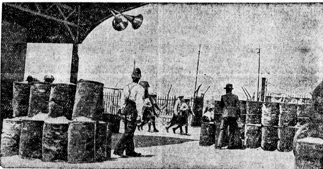
Az angolok drótsövényekkel és homokkal töltött benzines hordókkal védekeznek a kémek és a spanyol menekülők ellen Gibraltáriban.

— A szélsőséges jobboldaliak közül a jobhiszeműek külföldi hatalmak csapdájába esnek, akik a következő áriát éneklék: „Árulkodj el a Kisantantba tömörült szövetségeseit, s abban az esetben Magyarország és a Magyarországot támogató hatalmak a másik két állam határainak revíziójára fognak szorítkozni”. Természetes dolog azonban, hogy ugyanezt az áriát éneklék Belgrádban és talán Prágában is. Mi azonban nem hagyjuk magunkat becsapni e részletekben való revizionizmus elméletétől. Azért számunkra parancsszó: hogy egy blokkban álljunk az antirevizionisták táborában.