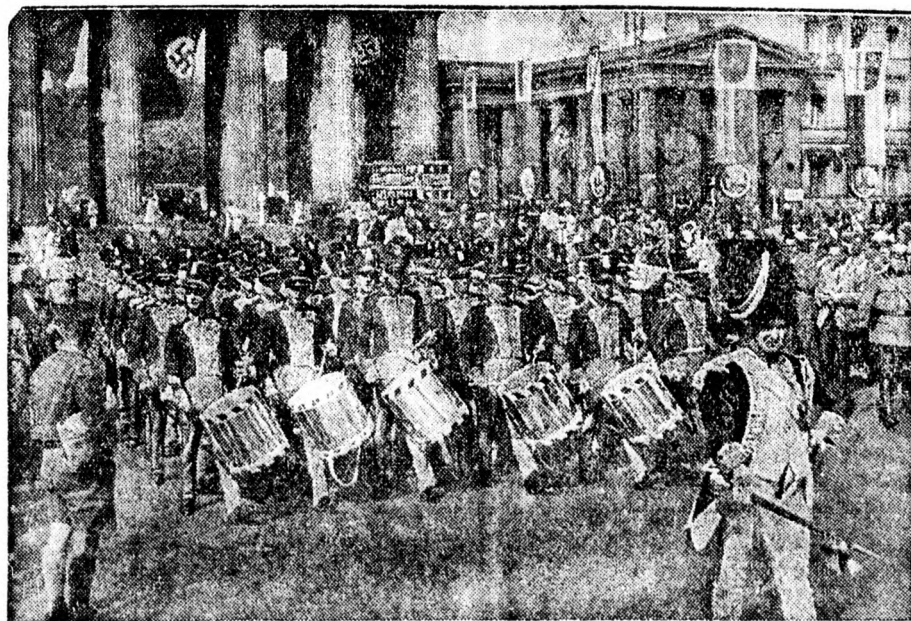
A svájci dobosok felvonulása Berlinben, az Unter den Lindenen.

mányhú polgárőrsztagok vonaton francia területen utaztak át. A lap fölveti a kérdést, hogy az ilyen csapatátengedés összeegyeztethető-e a semlegességgel. A „Daily Telegraph” jelentése szerint egy hét alatt 19 francia repülőgép érkezett Barcelonába.