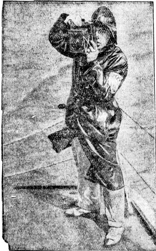
A fotóriporter, — az olimpia névtelen bajnoka.

Sighisoaranál kettészakadt a tehervonat s egy ingyen utazó gyermek lábát összetörte. Bucuresti. Saját tud. A Brasov és Sighisoara közötti vasúti vonalon Homorodnál hétfőre virradó éjjel vonatösszeütközés történt. Egy 50 vagonból álló tehervonat, amelyet két mozdony húzott, illetve tolt, kettészakadt s a hátsó rész beleszaladt az elsőbe. Nyolc vagon összezúzódott. Egy gyereket, aki potyautasként utazott az egyik vagonon, tört lábakkal szedték ki a romok alól. Másnak nem esett baja. A vonal annyira megrongálódott, hogy hétfőn délelőtt 11-ig csak átszállással lehetett közlekedni a vonalszakaszon. A reggeli vonatok pedig három óras késéssel érkeztek be Bucurestibe.