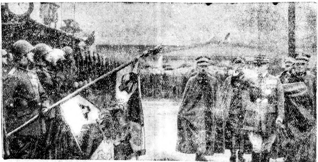
Gamelin tábornok elutazott Lengyelországból.

Láposy Zeneiskola Oradea, Strada Simeon Stefan No. 20. Hegedű, zongora és zeneelmélet tanszakkal.