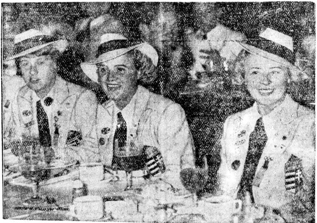
Magyar versenyzők vidám csoportja az olimpiai játékok befejezése után rendezett közös lakomán.

Láposy Zeneiskola Oradea, Strada Simeon Stefan No. 20. Hegedű, zongora és zeneelméleti tanszakkal.