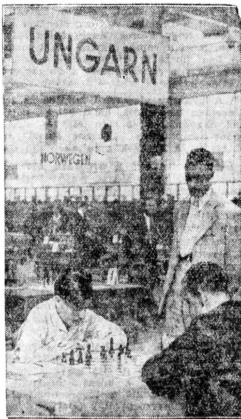
210 sakkmeister Münchenben.