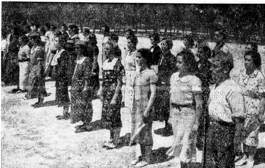
Női vörös hadosztály kiképzése Spanyolországban.

Felozlatták a bécsi emigránsok egyesületét. Bécsből jelentik: A magyarországi kommün bukása után a kommunisták tudvalevően az egész országból Bécsbe menekültek, ahol megalakították a magyarországi emigránsok egyesületét. Most a bécsi rendőrfőnök az egyesületet felozlatta.