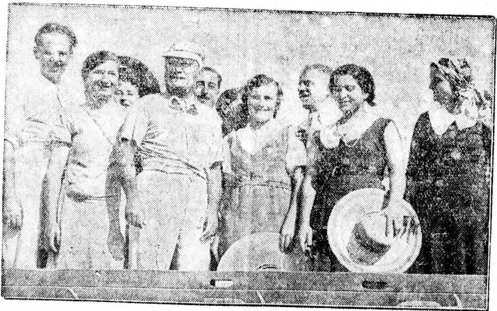
Mussolini a Pontini mocsarak helyén épült Pontinia falu aratómuukásai között, egy tehergépkocsin, amellyel a cséplőgéphez ment.

A diófát tilos kivánni és árulni szeptember 15-ig. A földművelésügyi minisztérium szőlőszeti osztályának rendelete alapján szeptember 15-ig tilos a diófatorzseket kitermelni s ugyancsak tilos a raktáron levő diófatorzseket áruhobocsájtása is. Oradeán az időközi bizottság külön hirdetményben adta ezt hírül, azzal, hogy mindazoktól, akik ezen rendeletet áthágják, a város köztisztviselése üzemnek erre feljogosított ügynökei el fogják kobozni az áruhobocsájtott diófatorzseket.