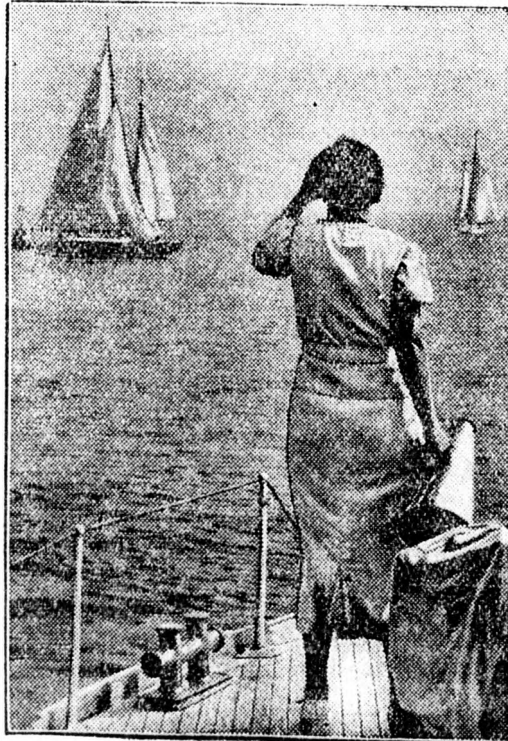
Hangulatos kép a kieli vitorlásversenyekről.