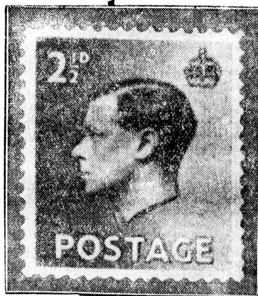
Az első angol bélyeg Eduárd király képével.

A földrendések pusztításai. Londonból jelentik: Dr. A. M. Heron, az indiai földtani intézet igazgatója, Simlában tartott előadásában ki-jelentette, hogy az elmúlt két évszázadban 2,750,000 személy vesztette életét földrendések következtében. Ezenként átlag 400 földrendést jeleznek, de ezek nagyságát csak gyenge lőkések és évenként csak 4—5 okoz nagyobb pusztulást, azonban a legutóbbi három évszázadban mind sűrűbben ismétlődnek a súlyosabb földrendések, aminek okát az előadó a felső földréteg egyenlőtlen megterhelésében látja.