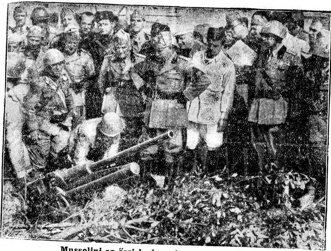
Mussolini az őszi hadgyakorlatok színhelyén megtekint egy új légharóító ágyút.

Reichenau kijelentette a japán újságíróknak, hogy a tárgyalások eredményével nagyon meg van elégedve.