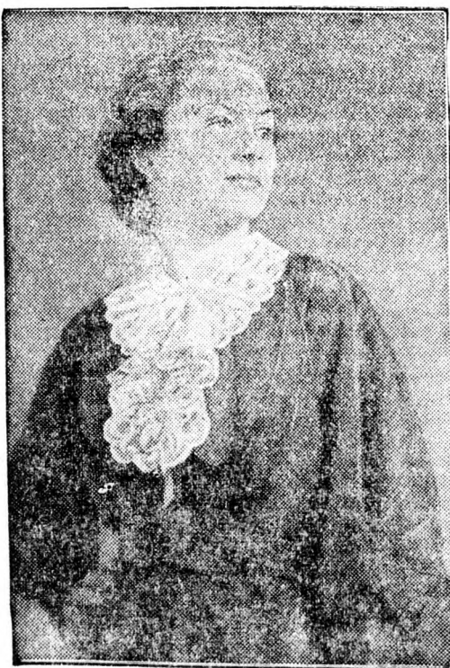
Divatos őszi délutáni ruha.

Kéménybe ütközött a kőd miatt a re- pülőgép és pilótája szörnyethalt. Bucuresti. Saját tud. Szerdán reggel halálosvégi repülőszerecsétlenség történt Iasiiban. Mihai Platon iasii repülőistét reggel 9 órakor felszállt egy Potez-típusú repülőgéppel, hogy gyakorló-repülést végezen. Először Iasi város felett keringet, majd miután esni kezdett az eső, jobb időt keresve, a város környéke fölött repült tovább, itt azonban sűrű ködbe ért, amiért a fiatal hadnagy egészen alacsonyra szállt, hogy leláthasson a földre. Poieni község határa fölé érve azonban, Ileana hercegnő birtokán a tanyai épület kéményébe, majd egy fába ütközött és lezuhant. A gép összezúzódott. Platon hadnagy pedig ülőhelyében azonnal meghalt. A szenvedett sérülések következtében.