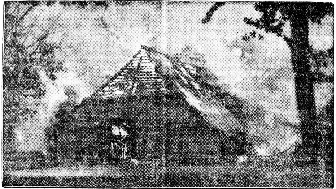
A Ludwigslust melletti Warlow nevű német községben tűz ütött ki és huszonegy lakóház porig égett.

fűznek hozzá kommentárokat. A legtöbb lap csak annyit jegyez meg, hogy Hitler kiáltványa nagy feltűnést kelt. Az Oevre megjegyzi, hogy amennyiben Németországnak határozott a békeakarata és békés törekvéseire biztosítékot is nyújt, Franciaország nem tartja lehetetlennek, hogy visszajuttatja Togót és Kamerunt — azt a két középfrikai gyarmatot, amelyek a világháború óta Franciaország fennhatósága alatt állnak. Franciaország azonban csak Angliával teljes egyetértésben tehet ilyen ajánlatot és az még nagyon kétséges, hogy Anglia mit szól ehhez a kérdéshez.