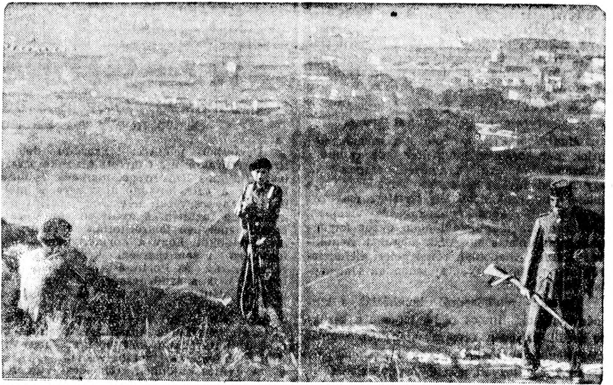
Spanyol nemzeti csapatok San Sebastian előtt.