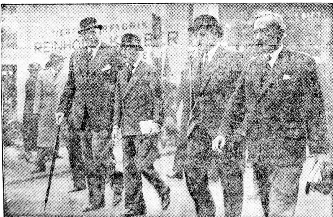
Az angol király meglátogatja Bécsben az Őszi Vásárt. Kiséretében vannak (balról) D. Heine miniszter és (jobbról) Draxler miniszter.

A nagyszerűen sikerült lovasünnepély végén kiosztották a díjakat.