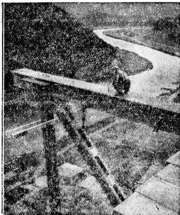
Új híd a németországi Werra fölött hetven méter magasságban.