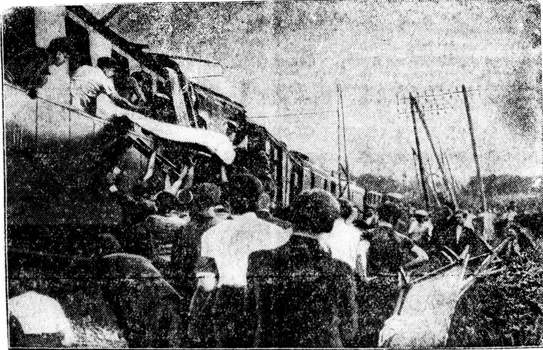
A Lourdes melletti vasuti szerencsétlenség színhelyéről.

Már a bajadérok is szervezkedtek. Bombayból jelentik: India bajadérai, akik a brahmanok fennhatósága alatt állanak s a szertartások ünnepeken táncolnak, most kollektív memorandumot intéztek az angol főhatóságokhoz, hogy számukra is vezessék be a nyolcórás munkaidőt, mert a brahmanok rendkívül kihasználják őket. Azt is követelik ezek a bajadérok, akik, úgy látszik, cseppet sem fogják fel romantikusan pályájukat, hogy a fizetésüket is rendszabályozzák. Az angol hatóságok meg fogják vizsgálni az indiai táncosnők petícióját, anyagi és munkahelyzetét és aszerint fogják intézkedéseiket megtenni.