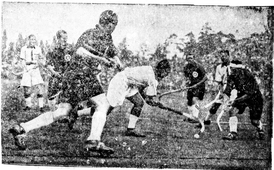
Hokey-verseny, az angol ifjúság legkedvesebb időtöltése.