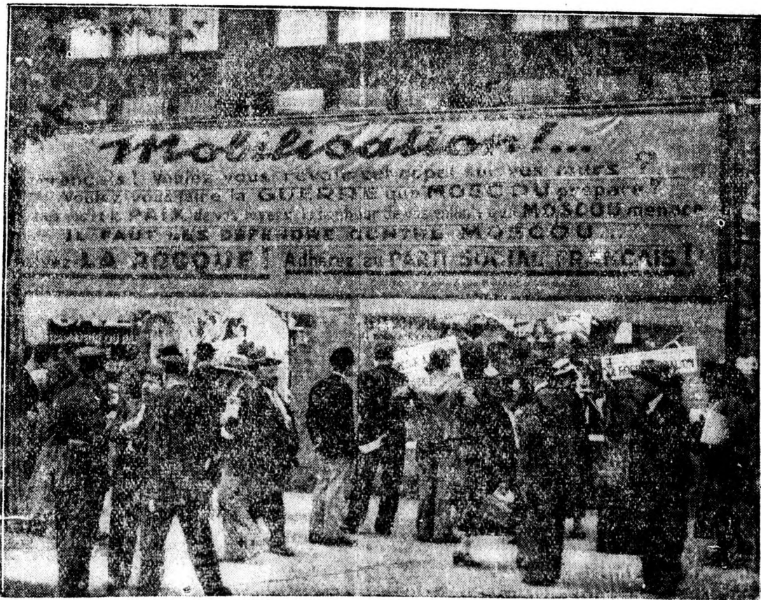
Párizsi falragaszok, amelyek a bolsevizmus veszedelmétől óvják a népet.

Franciaországban is egyre tisztábban látják azt a nagy veszedelmet, amelyet a moszkvai bolsevizmus elterjedése jelent. A napokban plakátok jelentek meg az utcákon a következő felirattal: „Mozgósítsát! Franciák! akarjátok-e ezt a felhívást újból látni falaitokon? Akarjátok-e azt a háborút, amit Moszkva készít elő számotokra? Ti béket akartok otthonaitoknak és boldogságot gyermekeiteknek. Moszkva ellene tör ennek. Védekeznünk kell Moszkvával szemben! Kövessétek La Rouquet! Gyülekezzetek a francia szociálisták táborában!”