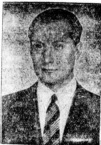
Primo de Rivera fia, akit a vörösök haditörvényszék elé állítottak

Alicantei jelentés szerint José Antonio Primo de Riverát, a diktátor fiát elfogták és haditörvényszék elé állították