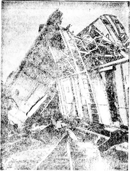
Vasúti szerencsétlenség Hollandiában

Párizsból jelentik: Madridból jött értesülés szerint az „Istenellenesek Szovjetország-