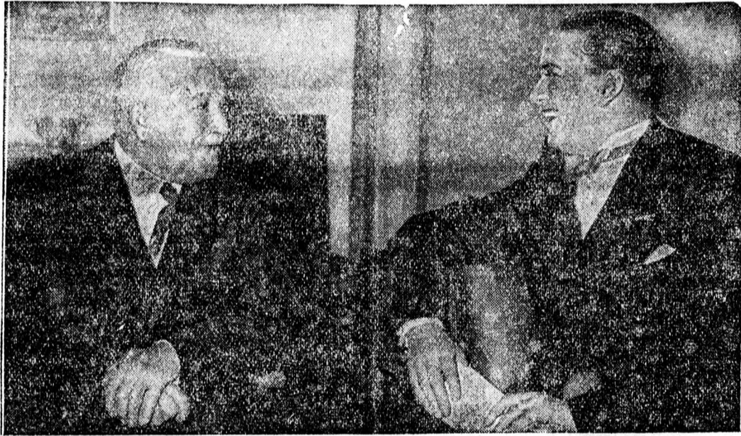
Ciano gróf olasz külügyminiszter (jobbról) Neurath német külügyminiszterrel.

Az osztrák lapok örömeiket fejezik ki, hogy Schmidt látogatása alkalmat ad a két országnak a szívélyes viszony és rokonszeny ujabbi kifejezésére.