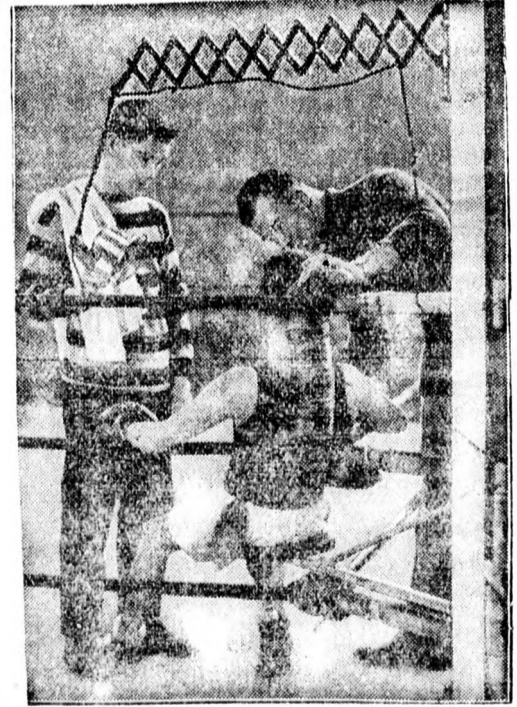
Ujítások egy londoni boxringben.

Kitűtőnek jó megjelenésű 16-18 éves fiú felvétetik Cziller Aruháza, Oradea.