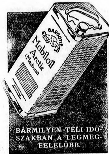
BÁRMILYEN Téli IDŐSZAKBAN A LEGMEGFELELŐBB.

Az ön autojának most más olajra van szüksége, mint nyáron. A téli üzemhez az az ideális olaj, amely egyrészt eléggé folyékony ahhoz, hogy a legnagyobb hidegen, — órákon át tartó parkirozás után is, — lehetővé tegye a könnyű beindítást, másrészt a motor legnagyobb felhevítésénél is tökéletes kenést biztosít. MOBIL OIL ARCTIC az a téli-olaj, amely ezt a nehéz kettős feladatot a legideálisabb módon oldja meg. MOBIL OIL ARCTIC biztosítja télen a könnyű beindítást és a tökéletes kenést. Emellett a hajtószerkezetről se teledkezzen meg! A hajtószerkezet könnyed és biztos működését csak — az ajánlásitáblázat alapján kiválasztott — megfelelő téliolajjal érheti el.