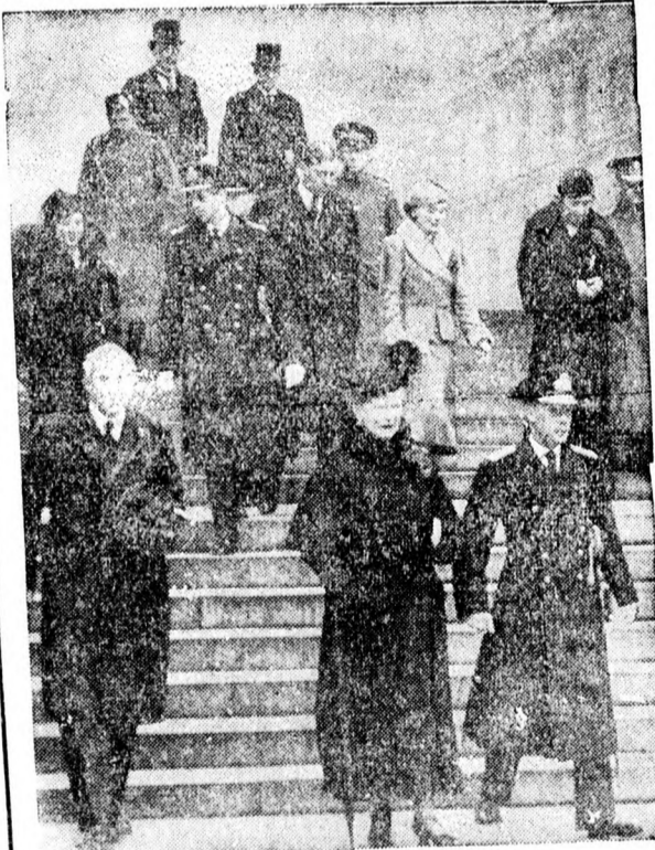
Hősök emlékünnepe Londonban a fegyverszünet évfordulóján