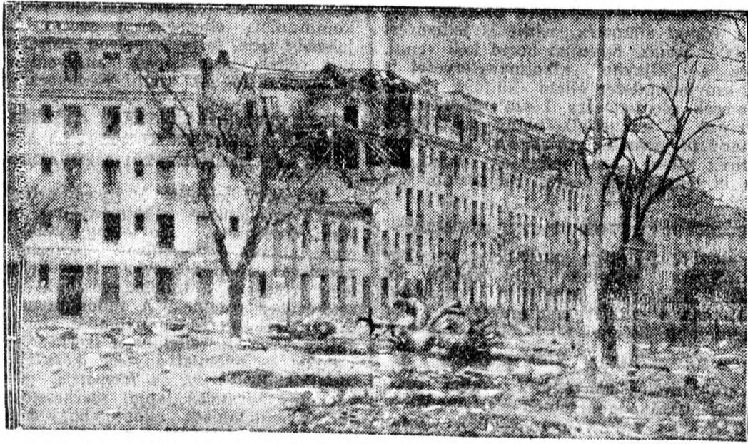
A spanyolországi vörös csapatok rombolásai Madridban.

Elkeseredett küzdelem folyik minden talpalatnyi földért. A vörösök mielőtt egy utcát átad-nának a nemzeti csapatoknak, felrobbantják a házakat és a villamos sínekét is megsemmisítik.