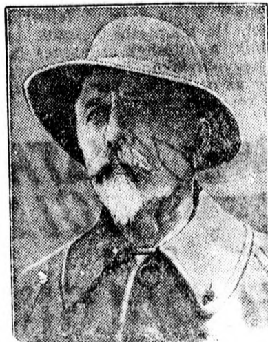
Meghalt Sir Basil Zaharoff. Európa titokzatos embere.

ÁLTALÁNOS FÉMIPARI SZTRÁJK KÉSZÜL FRANCIAORSZÁGBAN. Párizsból jelentik: Ujabbban a fémipari munkásság körében mozgolódás észlelhető és a lapok szerint a helyzet rendkívül aggasztó. Egyes lapok általában sztrájk kitörésétől tartanak. Ez Echo de Paris azt hiszi, hogyha csak időközben nem sikerül megegyezést kötni, december 6-án kitör az általános sztrájk, amely társadalmi katasztrófához vezethet. Kerilis, az ismert képviselő is cikkezik a sztrájkveszélyről és többek között azt írja, hogy a forradalom a kapuk előtt áll. Óva inti a kormányt, hogy fékezze meg a bolsevisták agitációját.