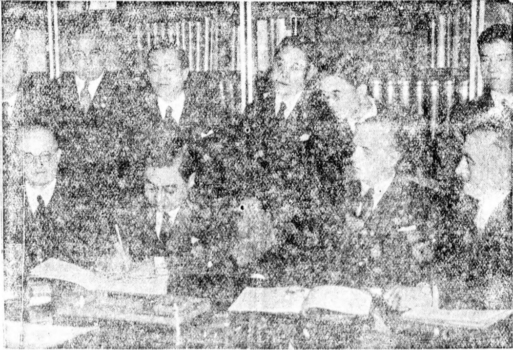
Aláírják a német-japán kommunistasellenes egyezményt