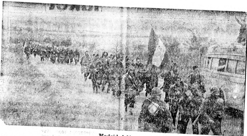
Madrid felé. Franco tábornok csapatai ellenállhatatlanul nyomulnak előre, a szabadság zászlója alatt. Utjuk célja: Madrid.

Az interpellációra Kánya Kálmán magyar külügyminiszter válaszolt és kijelentette, hogy ő is igyekszik eleget tenni a vízumkényszer eltörlésére irányuló óhajnak. Eltörlés esetén az idegenforgalom meg fog növekedni. Belgiummal, Franciaországgal, Hollandiával és Esztországgal folynak a tárgyalások ez irányban és hasonló tárgyalásokra kerül sor a többi államokkal is.