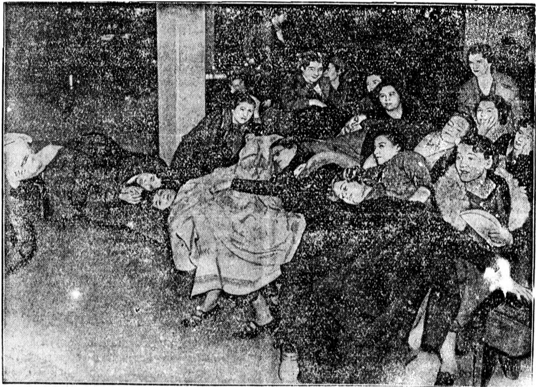
Amerikában is elfoglalják a sztrájkolók a gyárakat.

Légi si-expressz. Bécsből jelentik: A télisportok növekvő népszerűsége meghozta az első si-repülőjáratot. Ezt a járatot a holland repülőársaság tartja üzemen Rotterdam és Innsbruck között. A közvetlen repülőgép, amely csak kedvező hóviszonyok esetén jár, mindennap délelőtt tíz órakor indul Rotterdamból és este fél tíz órakor száll le Innsbruck repülőterén. A télisport holland barátai, akiknek lapos hazájában nem igen nyílik alkalma a síelés örömeinek élvezetére, nagy érdeklődést tanúsítanak a légi si-expressz iránt.