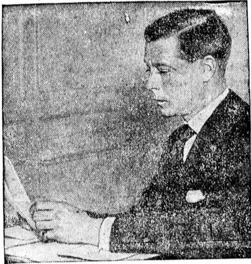
Windsor herceg, Anglia volt királya.

Bécsből jelentik: Az expressz, amelyen Windsor hercege utazik, vasárnap reggel 6