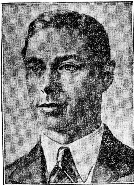
Anglia új királya.

veinek, s szilárdan elhatároztam, hogy az angol birodalom népei üdvéért odaadóan dolgozni fogok. Együtt feleségemmel, az én legbizalmasabb dolgozó társammal, magamra veszem a nehéz küldetés terhét, mely ne-