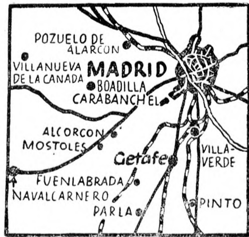
A Madrid körüli harcok térképe.

Olvassátok és teresszétek a Magyar Lapok-at!