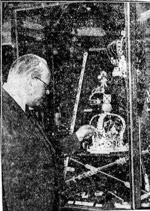
Az angol királyi korona és a koronaékszerek