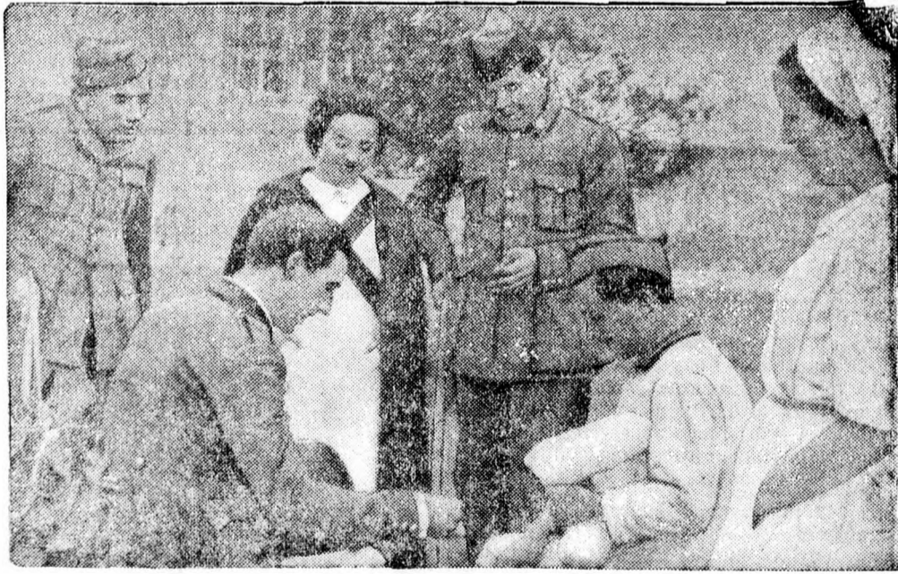
Kártyajáték a spanyol front mögött.