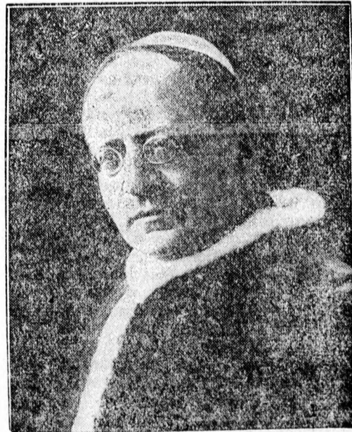
XI. Pius pápa betegsége előtt készült legutolsó arcképe