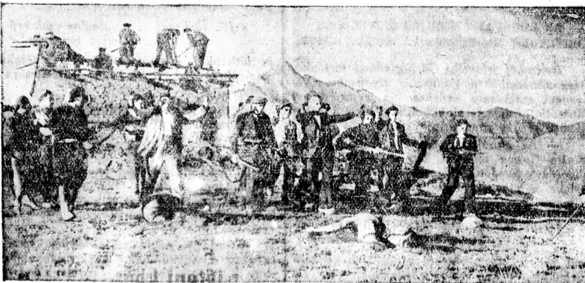
Harcok Madrid körül.

A részvénytársaságok és a nagy vállalatok, amelyek a speciális bizottság elé kerülnek, adóvallomásukat az év április végéig terjeszthetik a pénzügyigazgatósághoz. A fővárosi lapokban olyan hírek jelentek meg, amelyek szerint talán az idén is egyszerűen a múlt évi adóalapot hagyják meg úgy, ahogyan az tavaly történt. Eddig azonban a pénzügyminisztérium erre vonatkozólag semmiféle intézkedéseket nem tett és azért tanácsos, ha az érdekeltek a törvényes előírások szerint január végéig benyújtják adóvallomásukat.