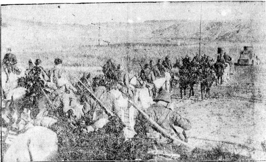
Csapatok vonulnak Madrid alá.

5. El kell tiltani a hadianyagok bevitelét Spanyolországba.