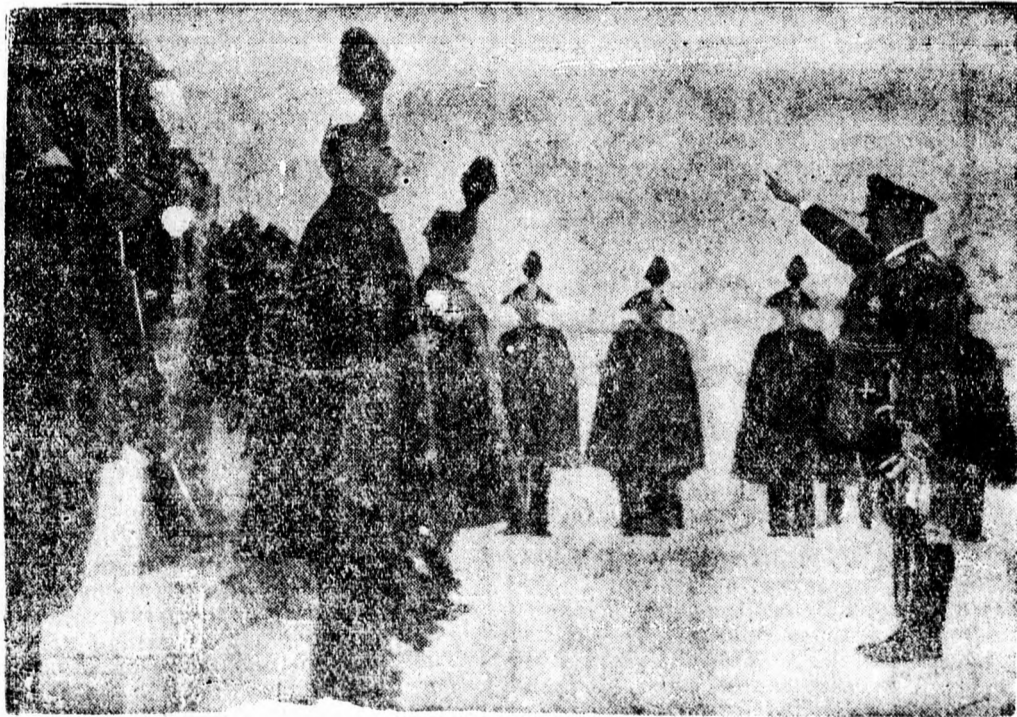
Göring a római Névtelen Katona emlékműve előtt.

Megírtuk, hogy Göring, Németország miniszterelnöke, Romában folytatott tárgyalásokat. Göring Romában a Névtelen Katona sírja előtt is úszolgett. Kapunk erről a jelenetről készült.