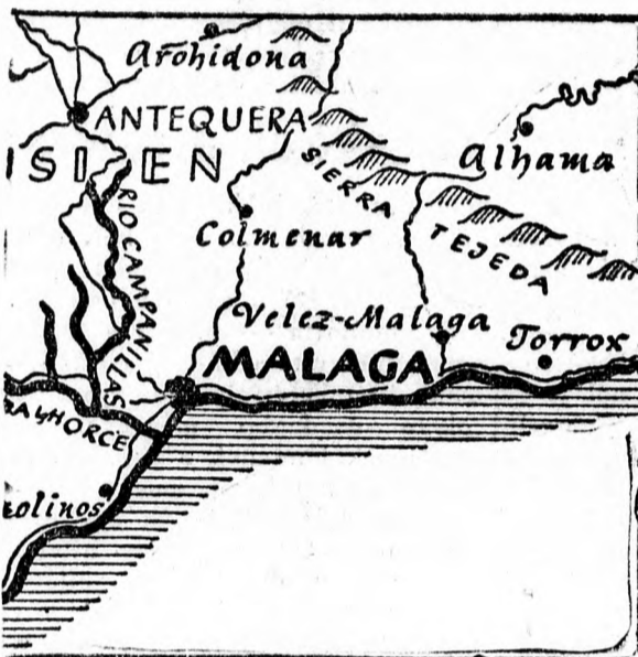
A spanyolok elkeseredett küzdelmei Malagáért.

A borsec-i állami iskolában 297 római katolikus magyarnyelvű tanuló van, továbbá 5 görög katolikus, 1 ortodox és 5 zsidó. A tárgy-muresi rendelkezés azt jelenti, hogy a 297 római katolikus magyarnyelvű gyermeket egy görögkeleti paptanító tanítaná hittanra román nyelven. Ezt azonban úgy az állami iskolai törvény, mint a vallási törvény, valamint a konkordátum határozottan tiltja. Nem is tudjuk tehát elképzelni, hogy a minisztérium ilyen súlyos hitvi sérelemre adott volna utasítást. Valami helyi tulbuzgóságról és elfogultságról van szó, amivel szemben az egész romániai magyar katolikus közönség nevében bizunk abban, hogy a felsőbb hatóságok azonnal megteszik a helyrehozó intézkedést.