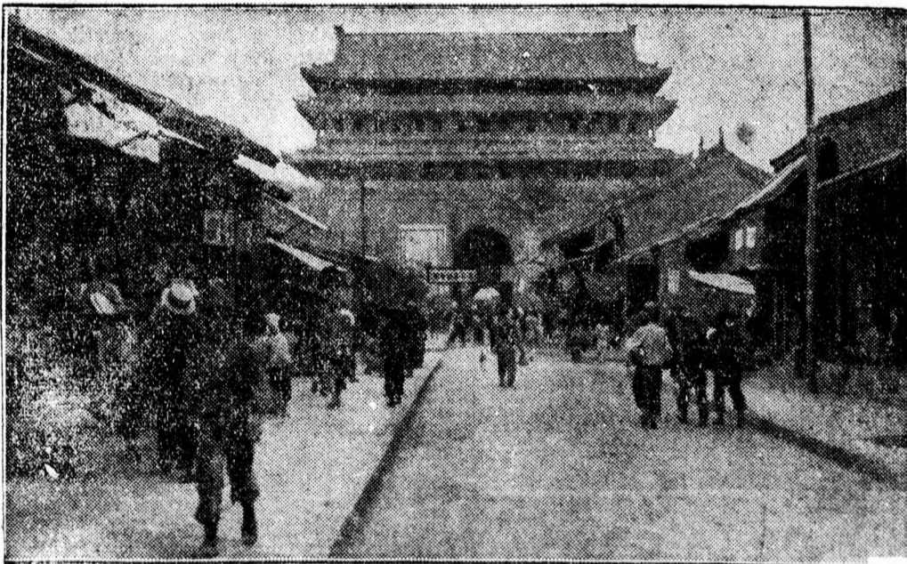
A kínai Sianfu egyik forgalmas utcája, ahol most forradalmi harcok dülnek.

kérdésben a genfi francia és török kiküldöttek kidolgoztak.